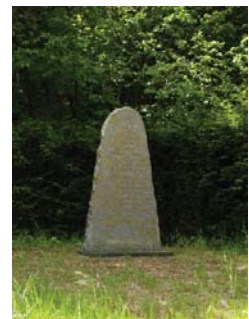
Monuments des aviateurs.