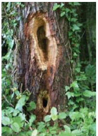
Un habitat sur mesure.