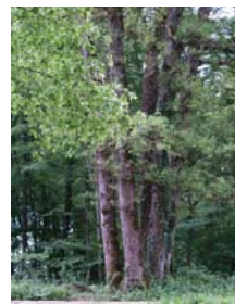
Le cépée des 5 frères.

1. Les 5 frères : cépée de 5 chênes ayant poussé sur la souche de leur ancêtre. Dos aux 5 frères, prenez le layon entre les coupes 9/10. Passez devant la bauge de sanglier puis prenez à gauche et poursuivez sur 500m environ. Prenez à droite en flanc de côte sur 350m puis à gauche (coupe 15). Poursuivez jusqu'au chemin du fond de vallée.